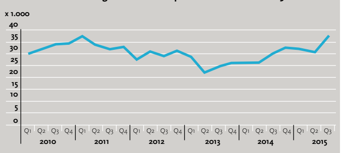
Totaal aantal nieuwe garanties NHG per kwartaal 2010 - 2015

De cijfers laten een stijging van het aantal garanties met 25 procent zien vergeleken met dezelfde periode vorig jaar. Dit wordt deels verklaard door een sterke groei van het aantal aangevraagde hypotheekoffertes in het tweede kwartaal, in aanloop naar de NHG kostengrensverlaging per 1 juli. De hypotheekaanvragen tot 1 juli hebben in het derde kwartaal geresulteerd in daadwerkelijk gesloten hypotheeklen en zijn nu zichtbaar in de resultaten van het WEW. Daarnaast weerspiegelt de stijging over geheel 2015 vergeleken met het vorige jaar duidelijk het herstel op de woningmarkt.